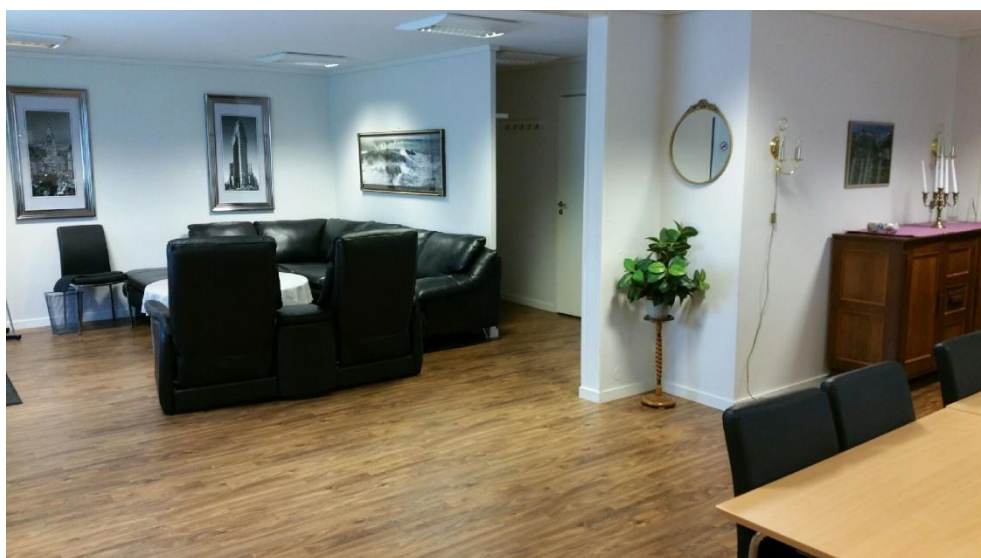
Det sosiale hjørnet, 2017