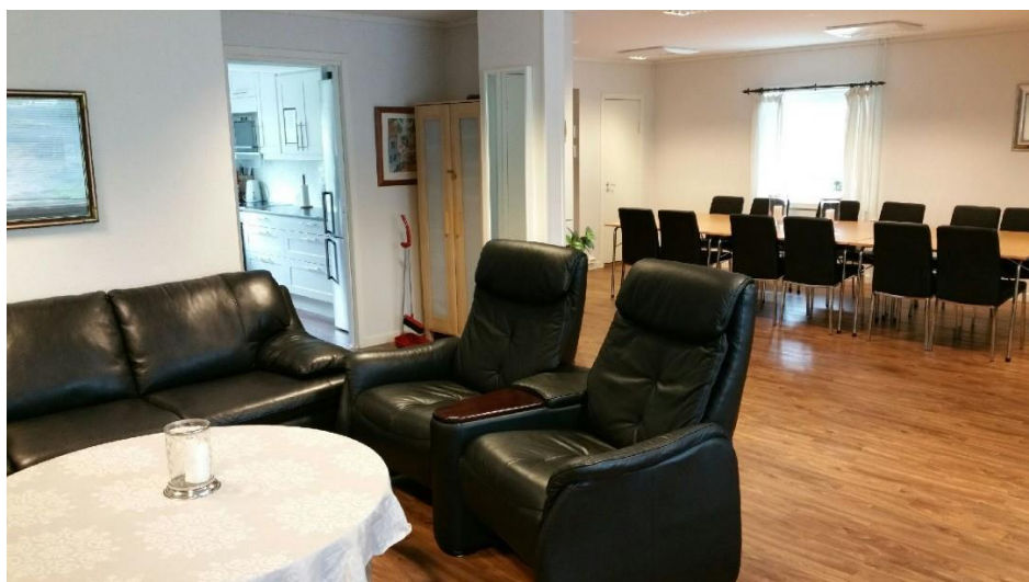
Det sosiale hjørnet, 2017